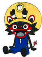
大牟田市公式キャラクター「ジャール」