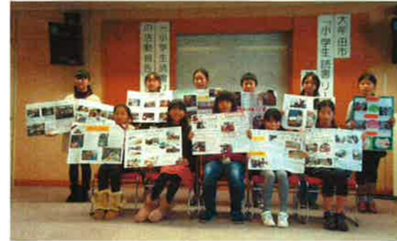
今年11名が読書リーダーになりました！

「大牟田市小学生読書リーダー養成講座」を受けて、読書リーダーに認定された子どもたちは、読書の楽しさや面白さを伝えるために、それぞれの学校で頑張っています。