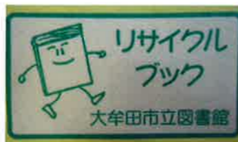
↑本にはこのシールが貼ってあります。

ブックリサイクルの開催前には、ポスターやチラシでお知らせします。 ※「広報おおむた」にも、随時お知らせを掲載します。