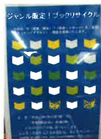
←ポスターやちらしで開催日をご事前にお知らせします。