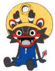
大牟田市公式キャラクター「ジャール」