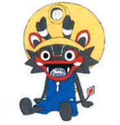
大牟田市公式キャラクター「シャリ坊」