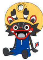
大牟田市公式キャラクター「ジャール坊」