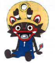
大牟田市公式キャラクター「ジャー坊」