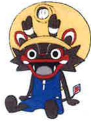
大牟田市公式キャラクター「シャー坊」