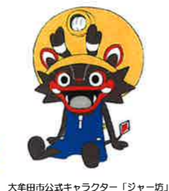
大牟田市公式キャラクター「ジャール坊」