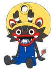
大牟田市公式キャラクター「ジャール坊」