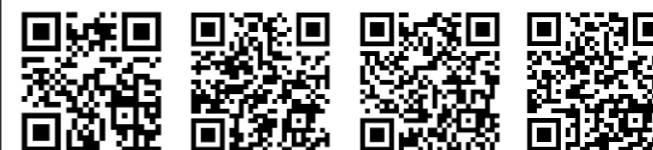
ホームページ Facebook X Instagram

▼大牟田市立図書館ではイベントやおはなし会、休館の情報などを随時ホームページやSNSでお知らせしています。左記のQRコードから、ぜひご覧ください。