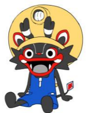
大牟田市公式キャラクター「ジャー坊」